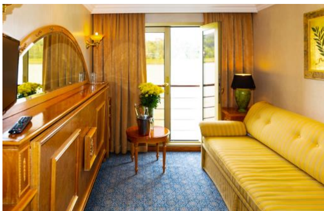
MS Princesse de Provence: Kabine

Das Schiff der gehobenen Mittelklasse verfügt ausschliesslich über Aussenkabinen mit zwei unteren Betten. Hiervon befinden sich 31 mit französischem Balkon auf dem Oberdeck und 37 mit grossem nicht zu öffnendem Fenster auf dem Hauptdeck. Die funktionalen ca. 11 m 2 grossen Kabinen sind mit individuell regulierbarer Klimaanlage, Dusche, WC, Haartrockner, TV, Bordradio und Safe ausgestattet.