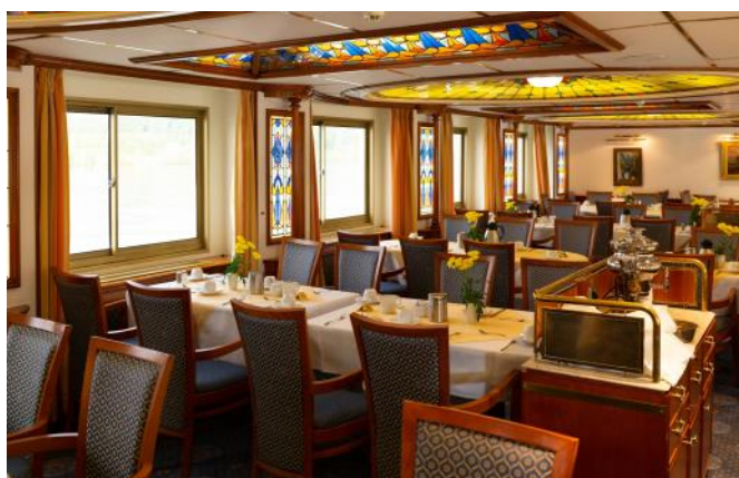
MS Princesse de Provence: Restaurant

Unsere Kreuzfahrt: Miltenberg - Würzburg - Bamberg - Nürnberg - Kelheim - Regensburg - Passau