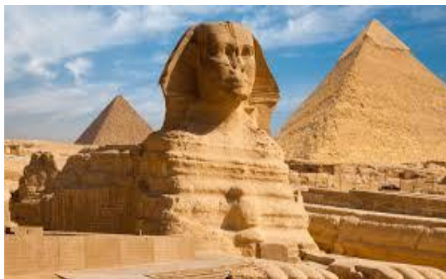
Sphinx von Gizeh