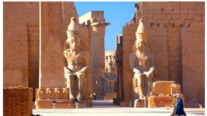
Karnak und Luxor Tempel