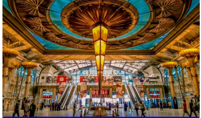
Bahnhof Kairo - Ramses II

Die Bahnstrecke von Kairo nach Assuan wurde schon 1863 gebaut. Ägypten hatte das erste Bahnnetz auf dem afrikanischen Kontinent. Die Bahninfrastruktur wurde nun ausgebaut und saniert. Die Nachtzüge fahren mit neuem Wagenmaterial und sind sehr komfortabel und sauber.