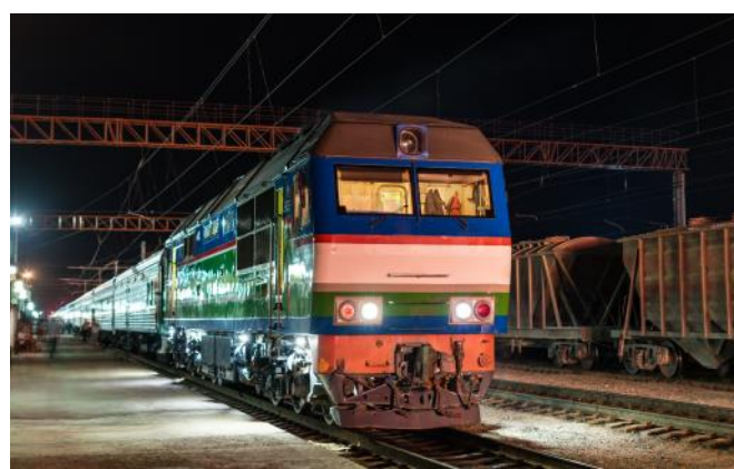
Le train du nuit Tachkent - Khiva