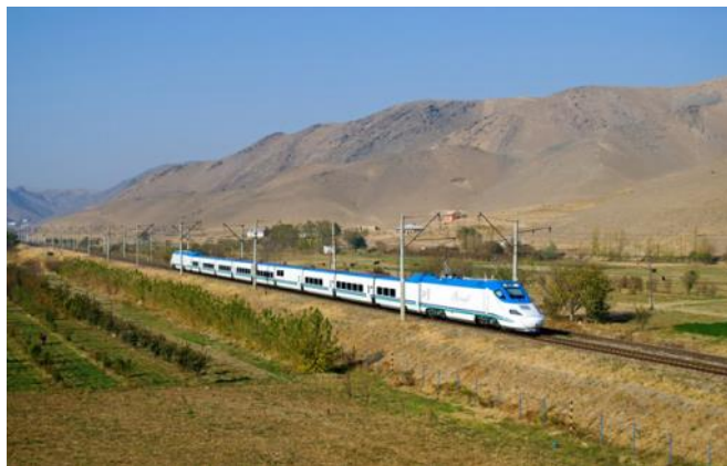
Le train à grande vitesse « Afrosiyob »