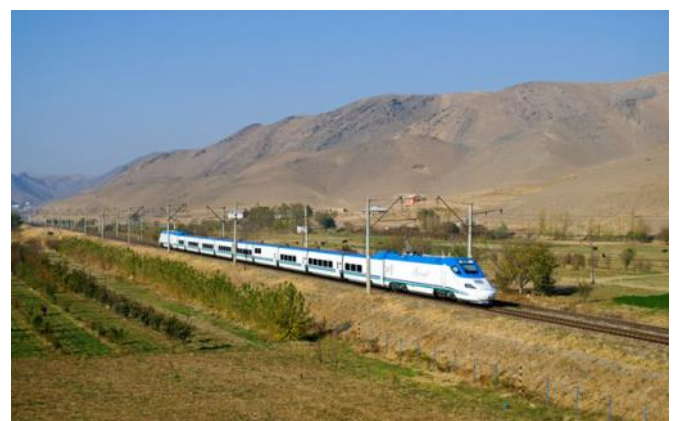
Afrosiyob Hochgeschwindigkeitszug Samarkand - Taschkent