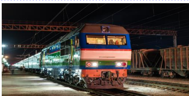
Nachtzug Taschkent - Chiwa