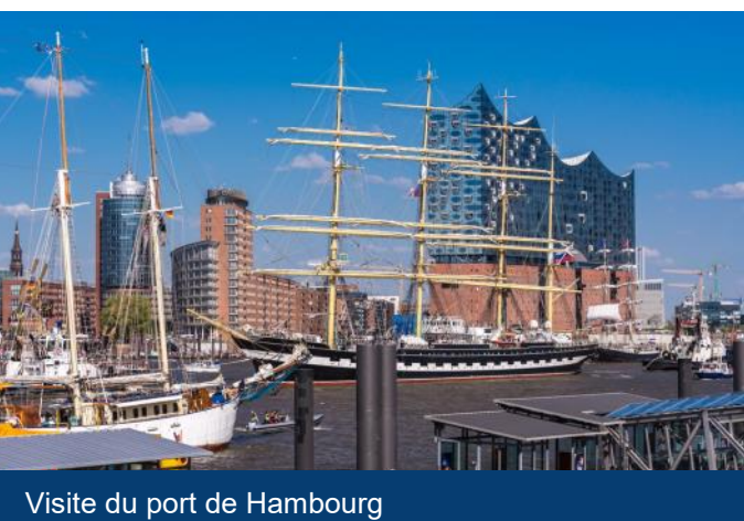
Visite du port de Hambourg