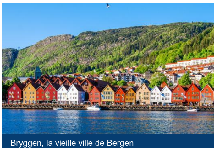
Bryggen, la vieille ville de Bergen

Voyage en bus spécial de Bergen en direction de Nærøyfjord le long du Hardangerfjord - Voss à Gudvangen, en empruntant la "Stalheimskleiva", l'une des routes les plus raides d'Europe du Nord, construite entre 1842 et 1846. La route a treize virages en épingle à cheveux. À Gudvangen, nous prenons un ferry et glissons à travers les étroits Nærøy- et Aurlandsfjord, qui sont tous deux des affluents du grand Sognefjord, jusqu'à Flåm. Dans l'après-midi, le chemin de fer de Flåm nous emmène du petit village au bord du fjord par de nombreuses courbes jusqu'au Myrdal (832 m). Juste avant Myrdal, le train s'arrête brièvement pour prendre des photos des chutes d'eau Kjosfossen. De Myrdal un train nous ramène à Bergen.