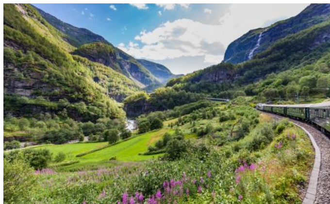
Le chemin de fer de Flåm

Trajet en train d'Oslo à Hamar, situé au bord du lac Mjøsa. Croisière sur le lac Mjøsa en bateau "Skibladner", le plus ancien bateau à vapeur du monde, construit en 1856. Avec ce bijou, nous glissons sur le lac Mjøsa jusqu'à Gjøvik. De Gjøvik, le chemin de fer de Gjøvik nous ramènera à Oslo.