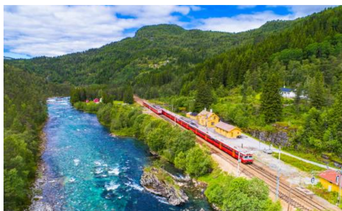
Le chemin de fer de Bergen