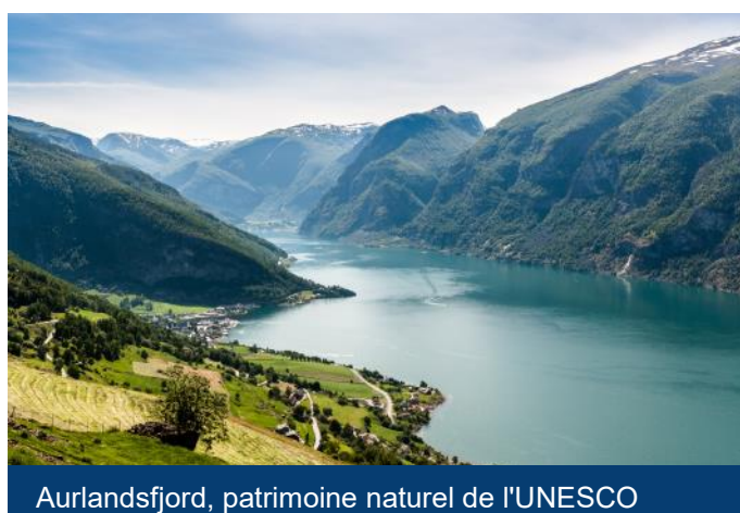
Aurlandsfjord, patrimoine naturel de l'UNESCO