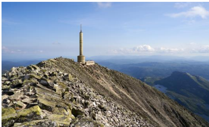
Magnifique vue depuis le Gaustatoppen