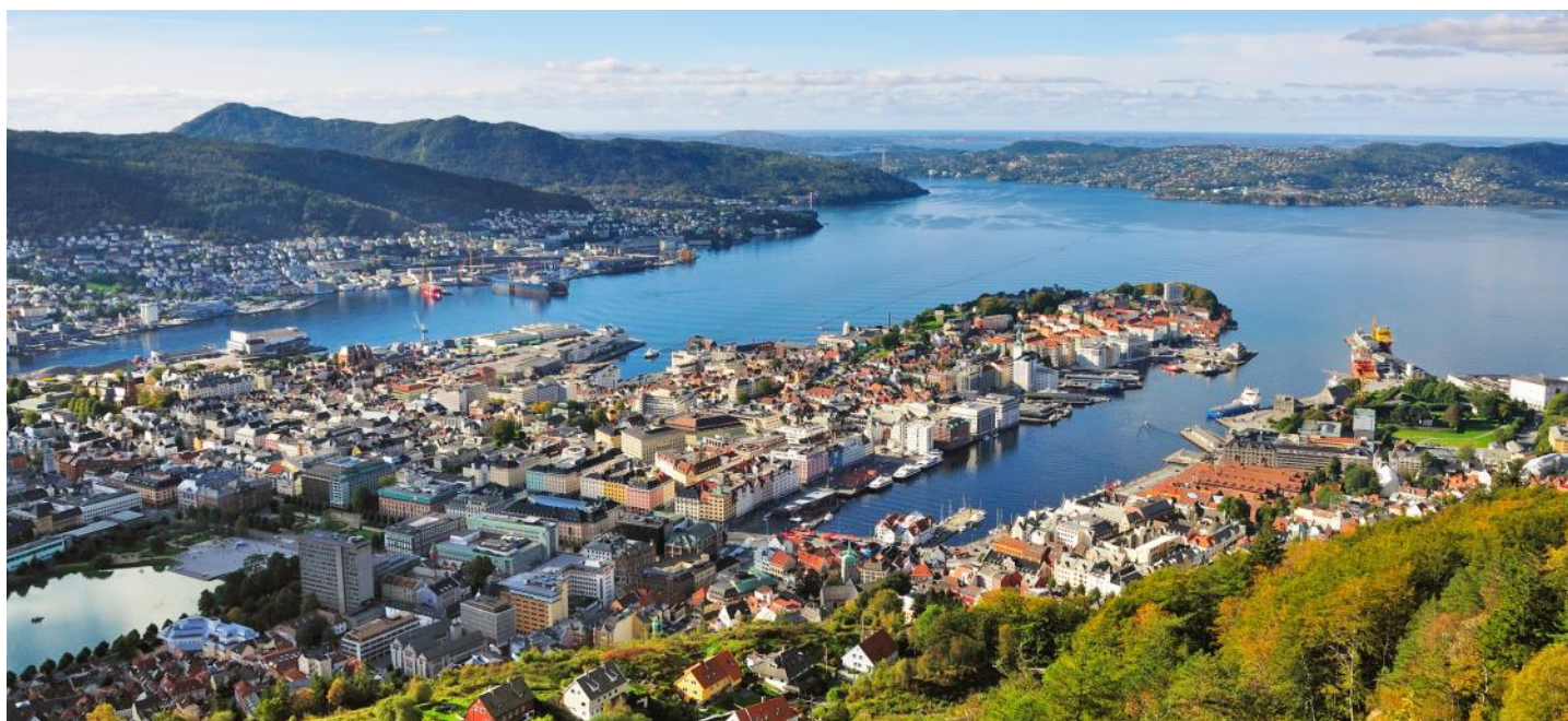
Vue sur la ville de Bergen