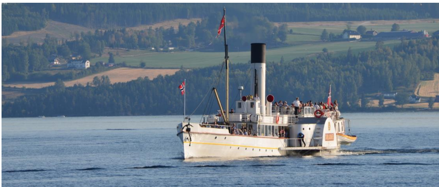
Le "Skibladner" le bateau le plus ancien du monde