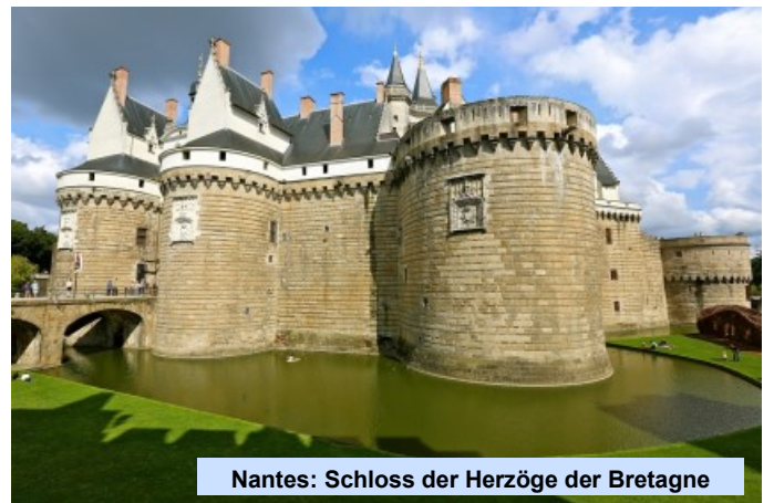
Nantes: Schloss der Herzöge der Bretagne