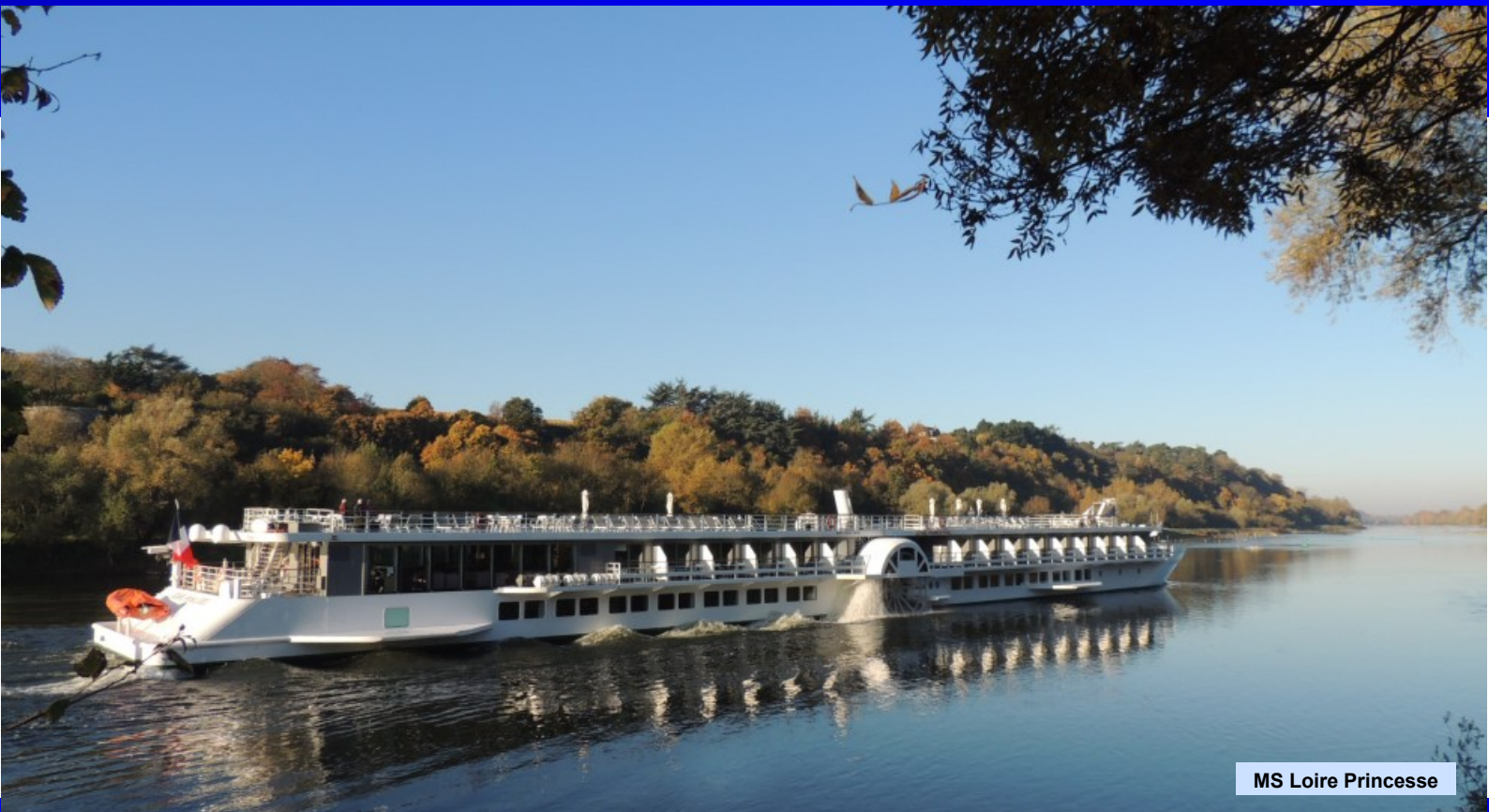
MS Loire Princesse