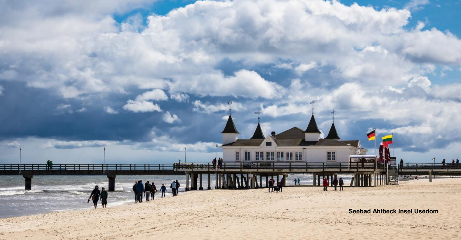
Seebad Ahlbeck Insel Usedom