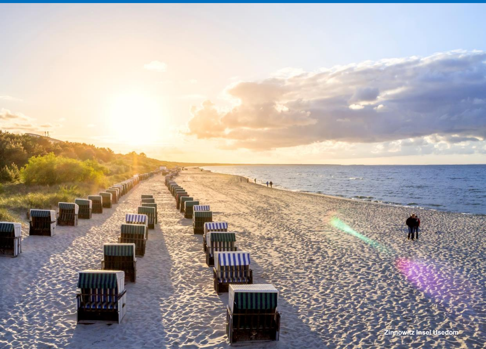
Zinnowitz Insel Usedom

Die malerischen Landschaften der Ostseeinseln Usedom, Rügen und Hiddensee sind das Ziel unserer Reise. Aufenthalt für sieben Nächte im komfortablen Hotel Maritim Kaiserhof in Heringsdorf auf Usedom. Auf Ausflügen genießen wir die Sehenswürdigkeiten und Naturschönheiten an der Ostsee.