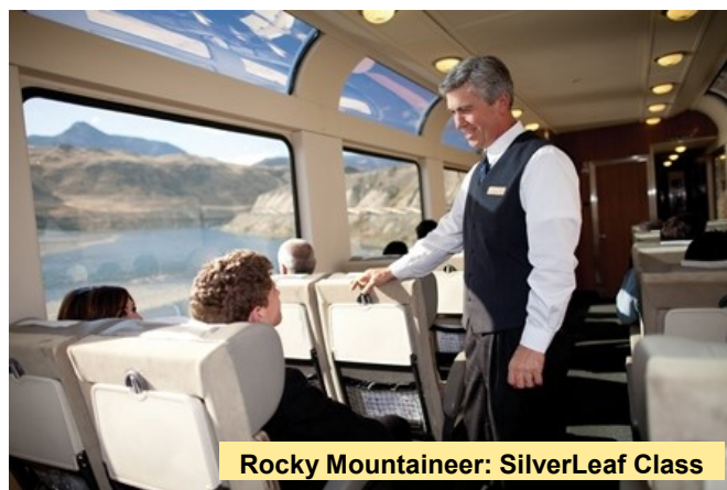
Rocky Mountaineer: SilverLeaf Class