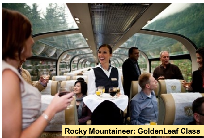
Rocky Mountaineer: GoldenLeaf Class