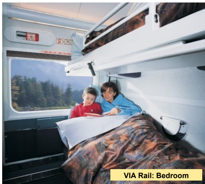
VIA Rail: Bedroom