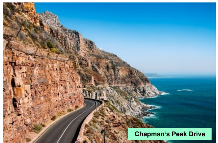
Chapman's Peak Drive