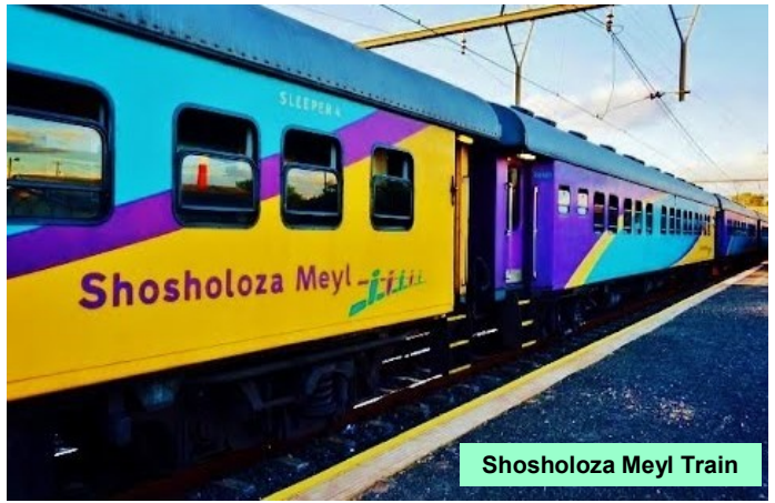
Shosholoza Meyl Train

Vormittag zur freien Verfügung. Am Nachmittag Rückfahrt nach Victoria Falls. Abendessen im Hotel und Unterkunft für zwei Nächte in Victoria Falls.