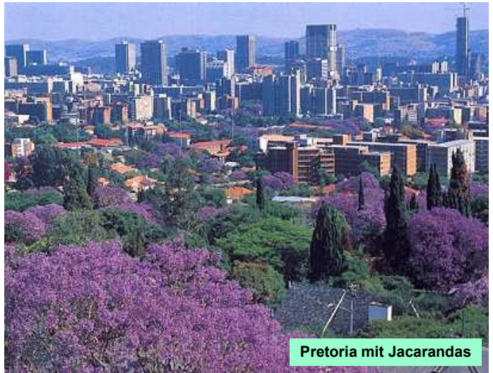
Pretoria mit Jacarandas