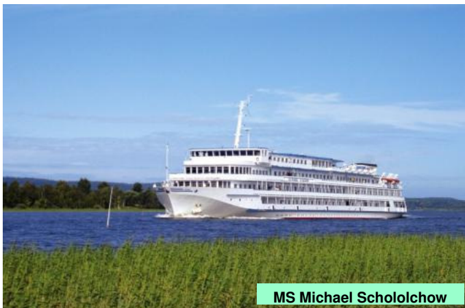
MS Michael Scholochow