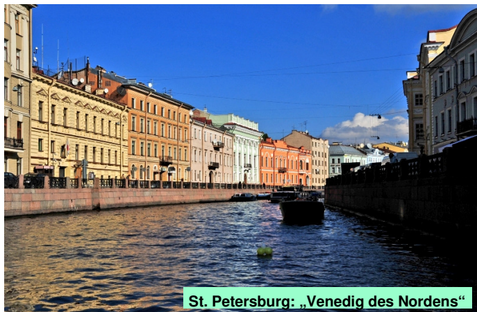
St. Petersburg: „Venedig des Nordens“